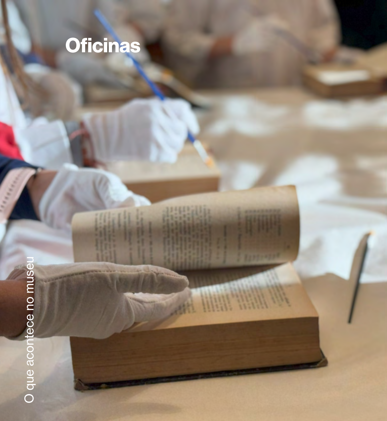
O que acontece no museu